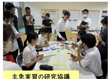
主免実習の研究協議